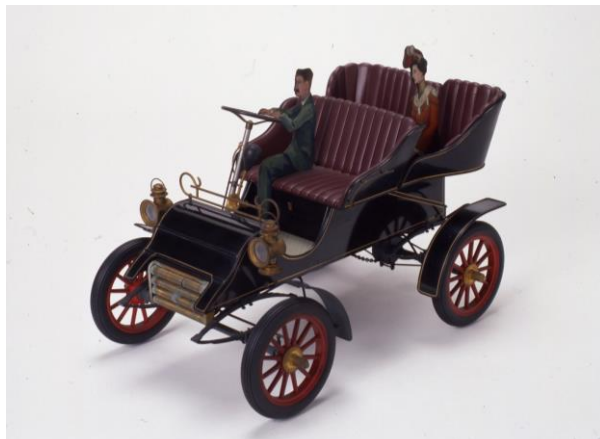
フォードA型 1903年型模型 1962（昭和37）年製作