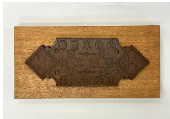
平岡工場の製造所銘板 1895（明治28）年