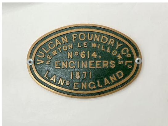
1号機関車の製造所銘板（複製）

鉄道車両には、車両銘板(車籍、製造所・メーカーの製造銘板、改造工事を施したときの工場の改造銘板等)が取り付けられています。本展では今年度寄贈されたコレクションを中心に国鉄(鉄道省)時代のもの、JRのもの、私鉄のものなどバラエティに富んだ銘板を200枚以上展示します。