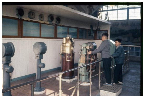
金剛丸の操舵装置 1940（昭和 15）年頃 交通博物館での展示の様子