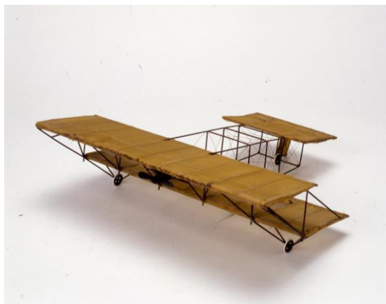
アンリ・ファルマンⅢ型模型 製作年不明

鉄道博物館の前身である交通博物館時代に展示していた乗用車やバス、航空機の模型や新幹線高速試験電車“FASTECH360”の1/20模型、風洞実験用模型など、模型コレクションを展示します。